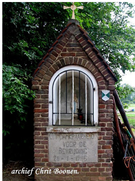
Maria kapelletje Leenderhof uit dankbaarheid