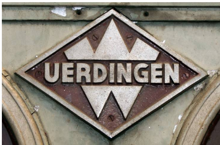
Het logo van Waggonfabrik in Uerdingen