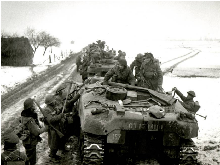
Britse troepen in opmars

Voor de aantekeningen per familie zal aangehouden worden de volgorde van het evacuatie overzicht.